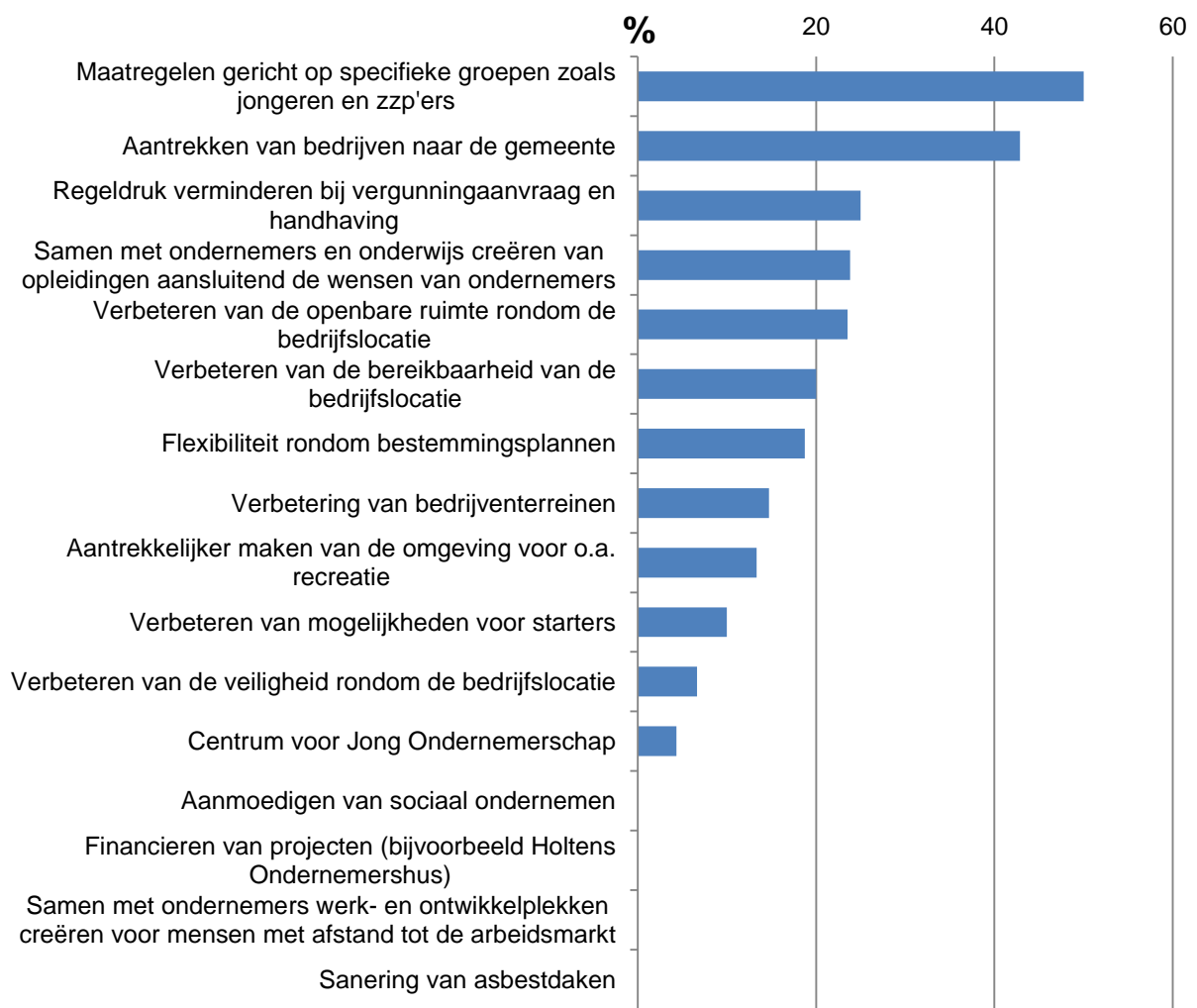
Figuur 4: Ingeschatte bijdrage van een maatregel in relatie tot de bekendheid van die maatregel

Relatief, dus wanneer de ingeschatte bijdrage van een maatregel wordt uitgedrukt in relatie tot de bekendheid van die maatregel, ziet het beeld er als volgt uit, zie figuur 4 hieronder. Zo vinden bijvoorbeeld twee van de vier personen die bekend zijn met de maatregel gericht op specifieke doelgroepen, deze nuttig.