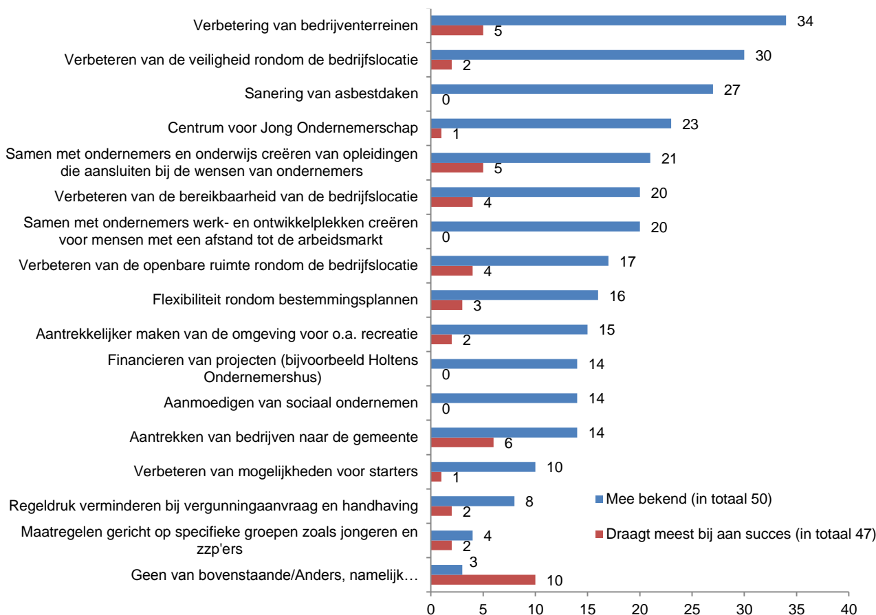
Figuur 3: Bekendheid van activiteiten van de gemeente

Enkele activiteiten hebben een zeer lage bekendheid: het verbeteren van mogelijkheden voor starters, het verminderen van de regeldruk bij vergunningsaanvraag en handhaving en maatregelen gericht op specifiek groepen, zoals jongeren en zzp'ers, zijn grotendeels of vrijwel onbekend. Slechts enkele van de respondenten, drie in totaal, zijn in het geheel onbekend met alle verschillende inspanningen van de gemeente. Hoe bekend ondernemers zijn met de activiteiten valt in het volgende figuur af te lezen aan de blauwe balken.